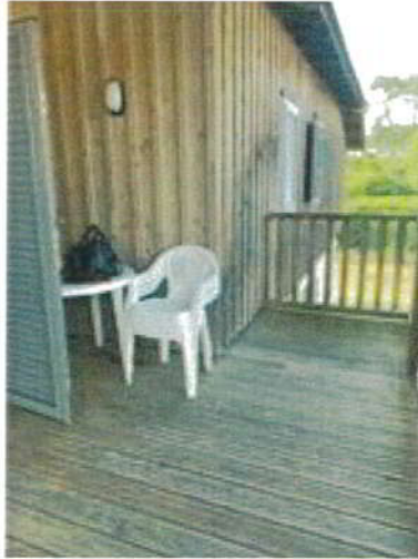
Vue depuis la terrasse.