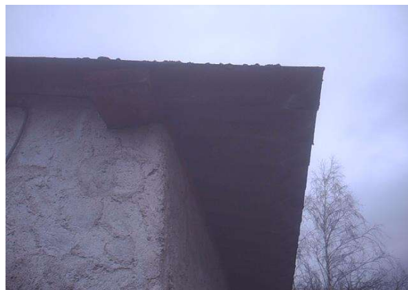
toles fibro ciment